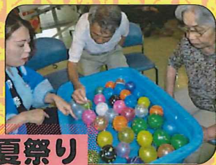
デイ夏祭り 縁日遊び