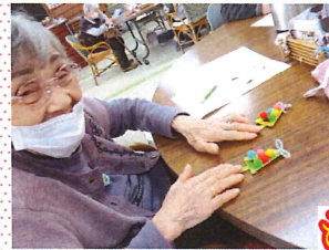
もみの木ホルダー