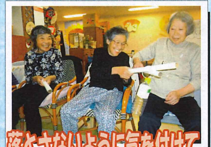
落とさないように気を付けて

10月11日(土)、13日(月)、14日(火)にデイフロアにて運動会を行ないました。皆さん元気に競技に参加され楽しい時間をすごされていました。