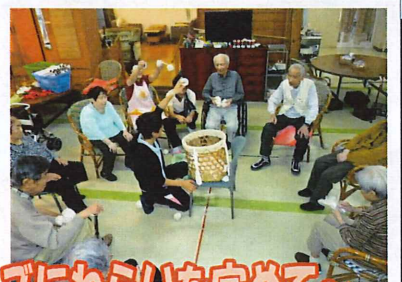
かごにわらいを定めて～

10月11日(土)、13日(月)、14日(火)にデイフロアにて運動会を行ないました。皆さん元気に競技に参加され楽しい時間をすごされていました。