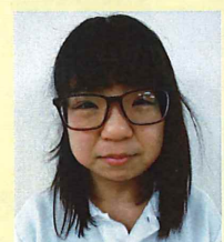
特別養護老人ホーム万葉苑 木もれ陽（3階）植林 茅穂

全く未経験から始めさせて頂き、日々経験と新たな気づきを頂いております。関わる方全てに幸せになって頂ければと笑顔で努めてまいります。まだまだ力不足では御座いますが貢献できる職員を目指して頑張ります！