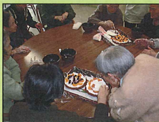
12月、おやつクリスマスケーキ作り