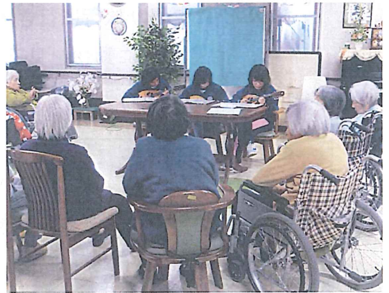
マンドリンを演奏している春日中学生

私は、福祉体験を終えていい経験になったなと思います。お年寄りの方とのコミュニケーションは、私が人見知りなので自分からはしゃべれませんでした。でもお年寄りの方からしゃべってもらえたのでよかったです。このような体験は、ふだんできないので、このような体験があってよかったです。