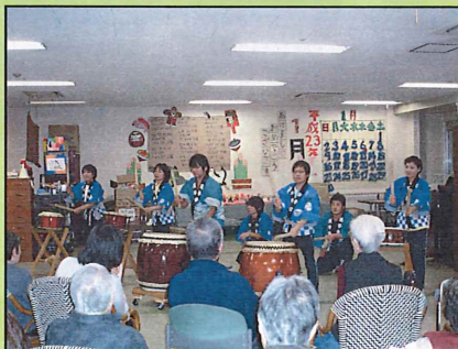
新年は職員の太鼓演奏で幕を開けました。