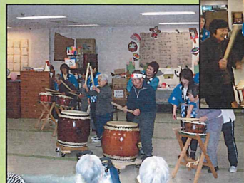
最後には利用者様も太鼓演奏に参加！