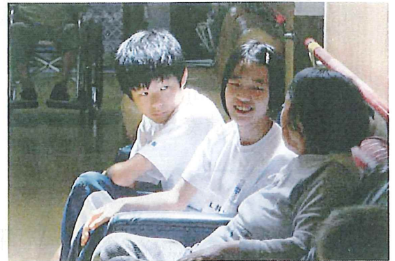
入居者とおしゃべり中の興東中学生