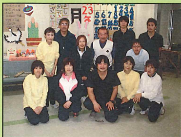
スタッフ一同よろしくお願ひします！

デイでは愉快なスタッフによる 日々の様々なレクリエーション、畑の作物の成長、喫茶コーナーでのティータイムも楽しめます。また、1年を通して様々な季節行事があり、歌、ダンス、楽器演奏などたくさんのボランティアさんの協力を頂いております。