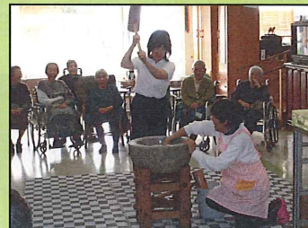
年末、恒例の餅つき大会