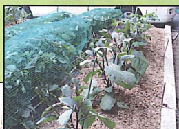
畑と 喫茶コーナー です。