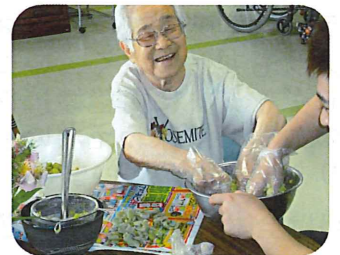
おやつ作りの様子