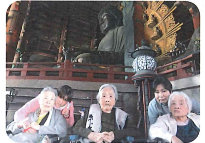
大仏様の前で記念撮影

東大寺へ大仏様の拝観に行ってきました。五月晴れの陽気で他の拝観者もたくさんでしたが、ゆっくり観て回ることができました。また大仏様の前では、入居者様は自然と手を合わせておられました。