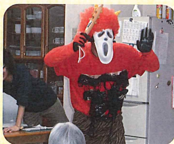
苑長の赤鬼はこうなります