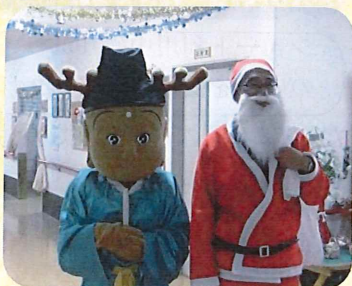
せんと君と苑長サンタ

ご利用者・ご家族様はじめ地域の皆様、先輩各位、また関係機関の各位ご指導・ご協力を頂けますよう合わせてお願いいたします。