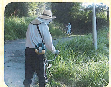
草刈中の苑長です